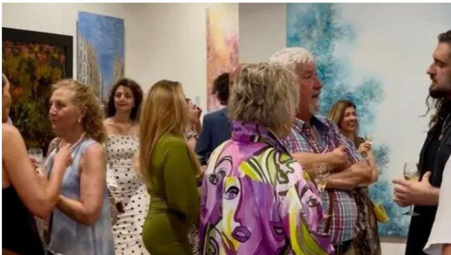
Fidelitas ARTe inaugura en Madrid una exposición que fusiona arte, tecnología y finanzas

La muestra, celebrada en el emblemático Hub Ayala 23, reunió a artistas internacionales, coleccionistas, inversores y figuras del ámbito político y deportivo