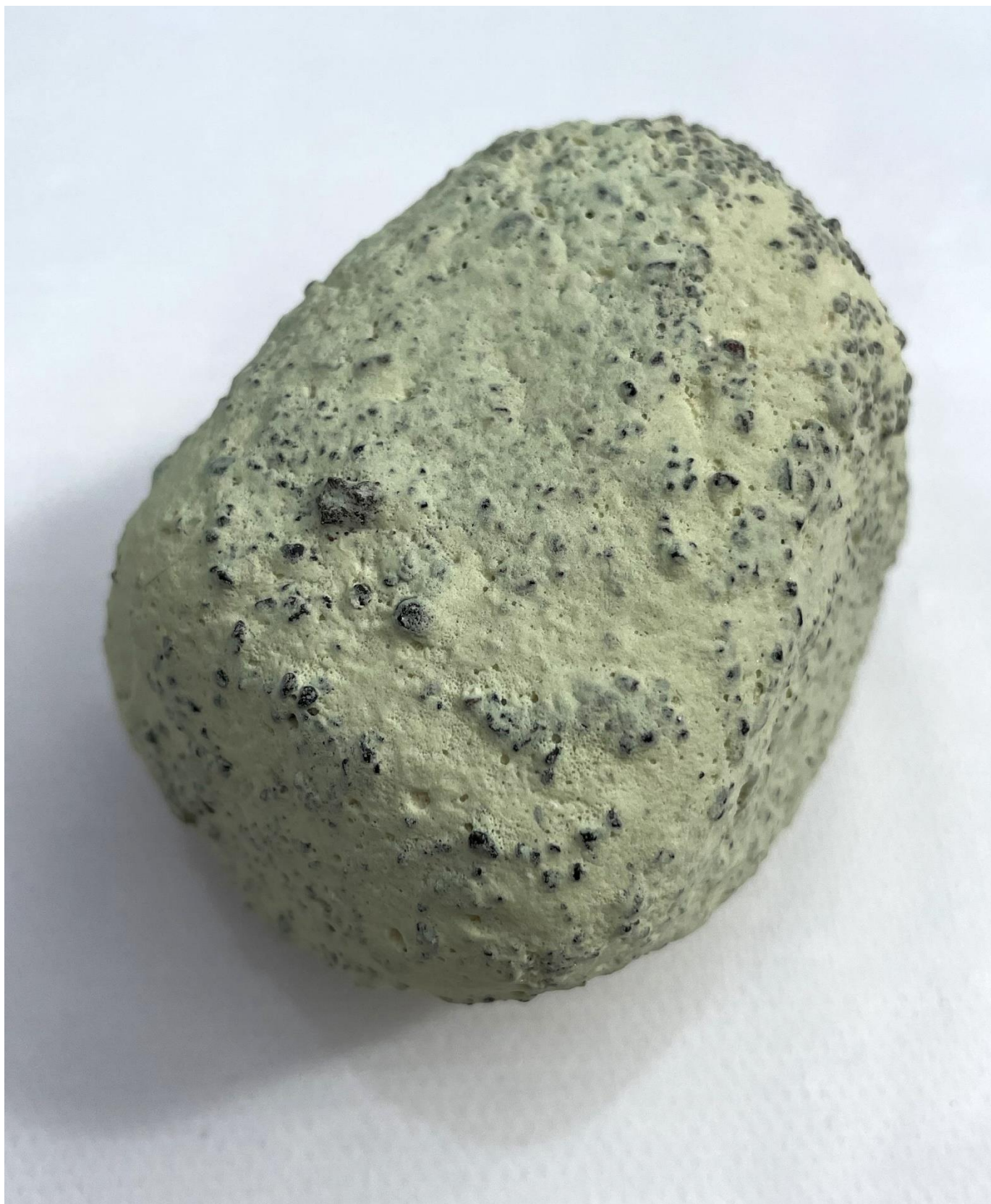
Cerámica fluorescente y arena volcánica