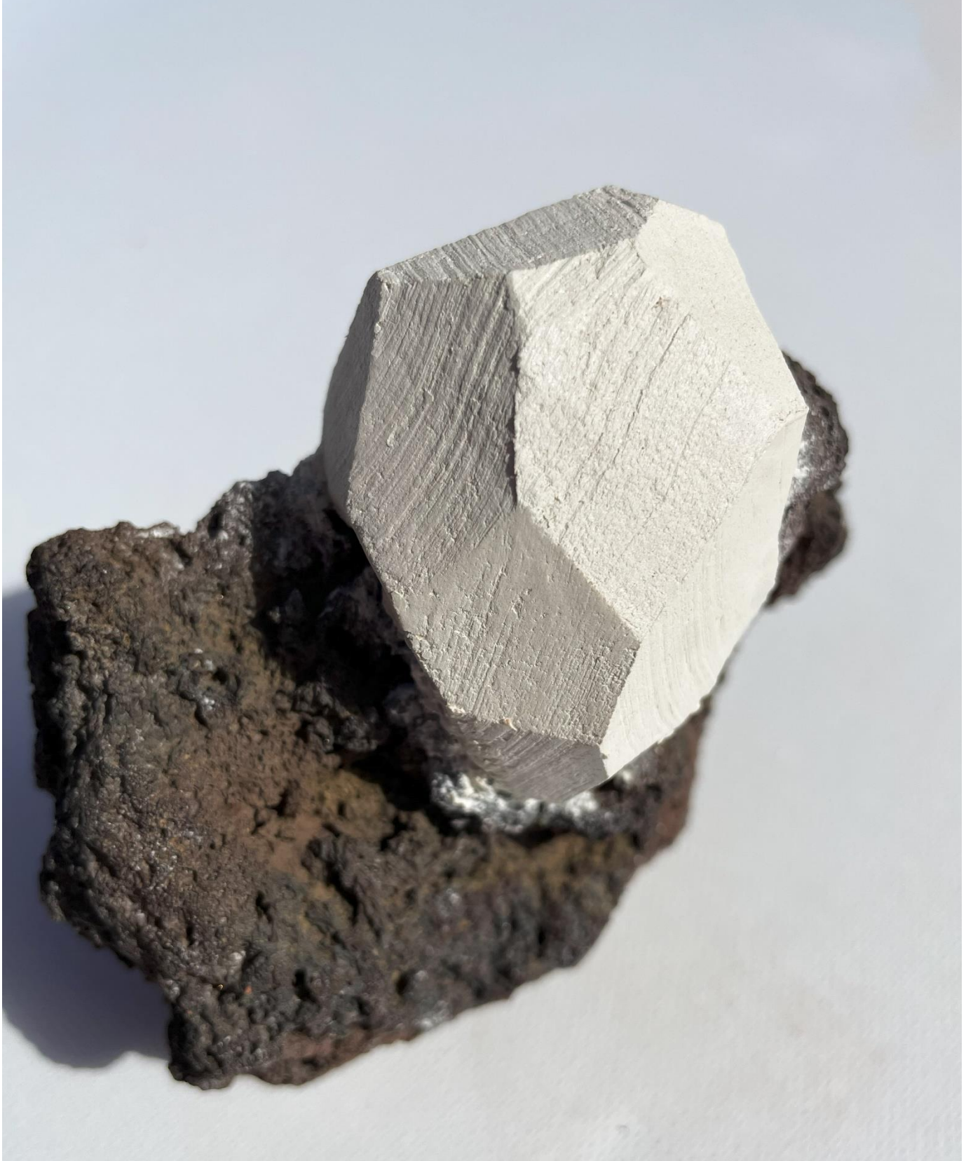
Cerámica blanca y piedra volcánica