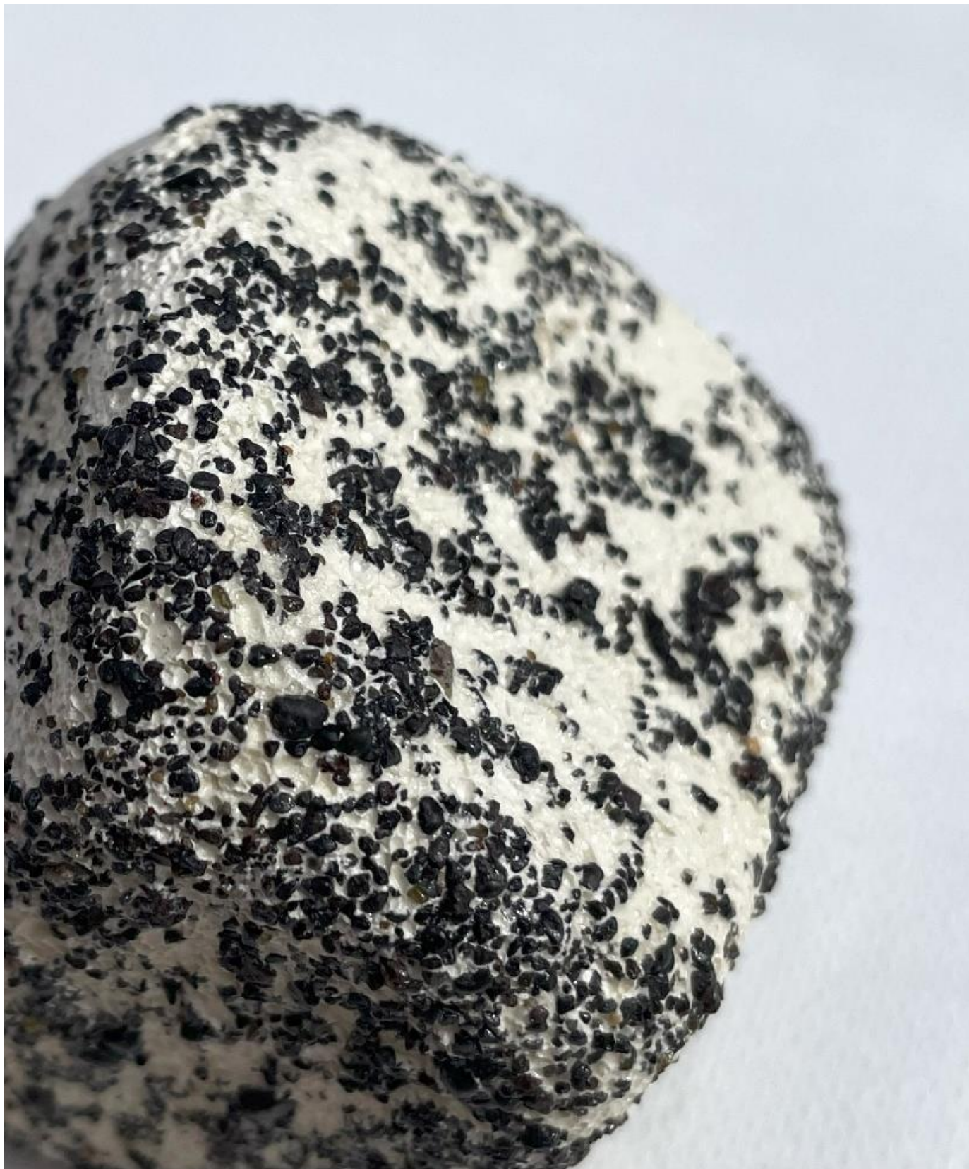
Cerámica blanca y arena volcánica