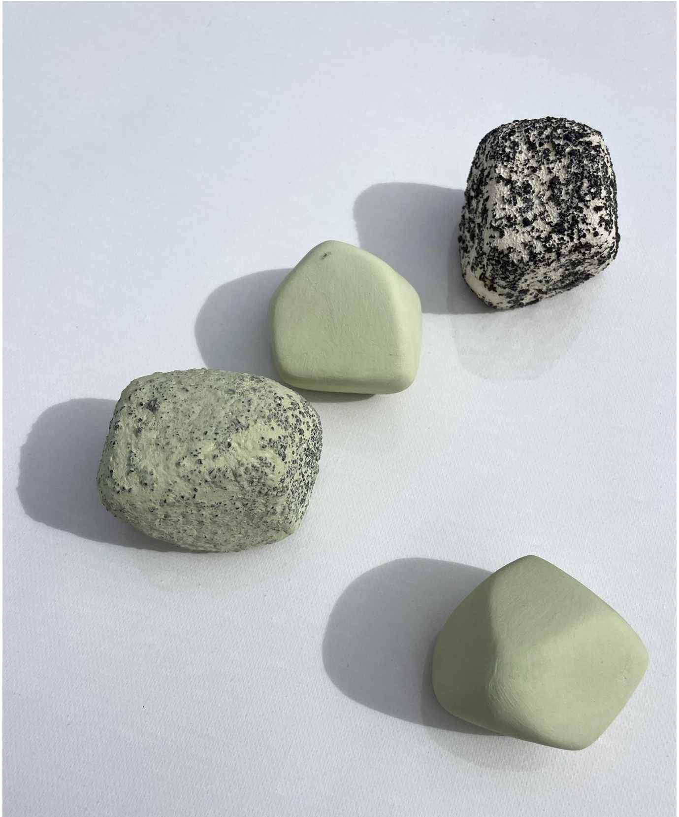
Cerámica fluorescente y arena volcánica

Serie Polinos - "Esculturas D8, D9, D10 y D11"