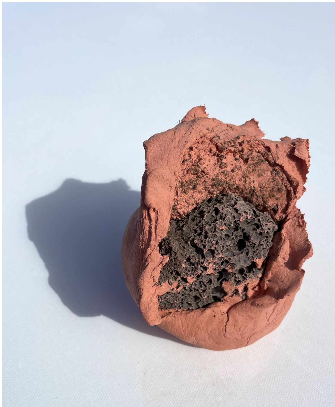
Cerámica marrón y piedra volcánica