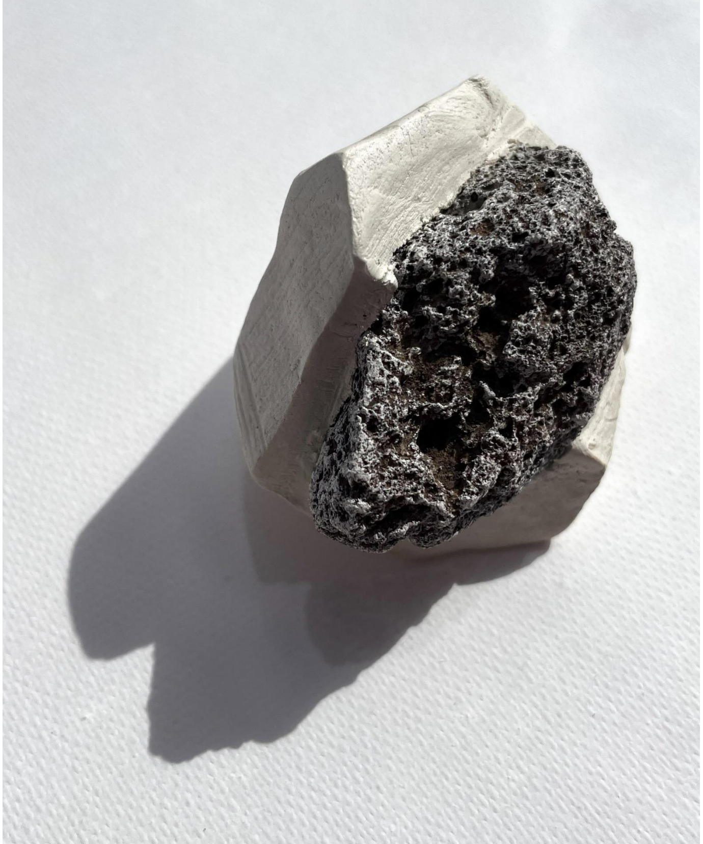
Cerámica blanca y piedra volcánica