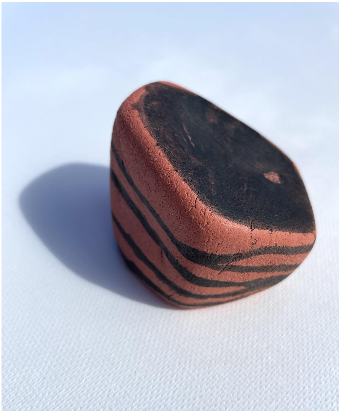
Cerámica marrón y pintura negra